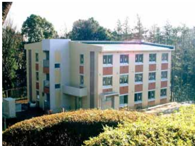
留学生会館の外観